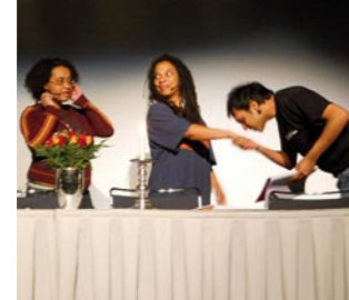
Module der Ausstellung »Homestory Deutschland«