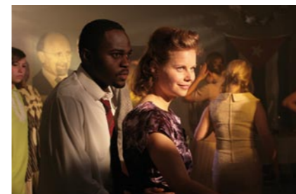
Szene aus dem Film »Beento«

»Beento« – DDR 1963: Sammy ist ghanaischer Austauschstudent. Er und Katharina sind ein Paar. Während Katharina, gegen den Willen ihrer Mutter, eifrig Zukunftspläne schmiedet, genießt Sammy sein Studentenleben und schmuggelt leichten Sinnes Beatles-Platten und sein Leibgericht – Sardinien in Dosen – in die DDR. Katharina hat immer weniger Verständnis für Sammys Eskapaden: Sie ist schwanger. Es geht um eine ernsthafte und gemeinsame Zukunft im Osten – die sich Sammy nicht vorstellen kann. (Eintritt für beide Filme frei)