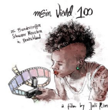
a film by Juli Rivera

2010) sind sehr subjektiv gedrehte Kurzfilme, die der Frage nachgehen, wie sich die ISD organisiert, und was sich genau hinter ihrem jährlichen Bundestreffen verbirgt. Zum Austausch mit dem Publikum werden ISD AktivistInnen vor Ort sein. (Eintritt frei)