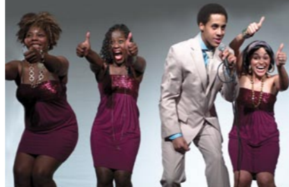
Szene aus der Theateraufführung »Heimat, Bittersüße, Heimat«